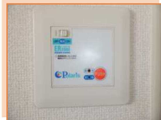
電動式水抜栓開閉装置