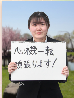
商工労働観光課 企業労政係