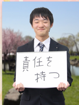
都市計画課 管理係