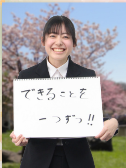
介護福祉課 高齢者支援係

4月1日より、10名の新しい職員が加わりました。まだまだ未熟ですが、市民の皆さんに寄り添いながら、日々の業務に取り組んでまいります。