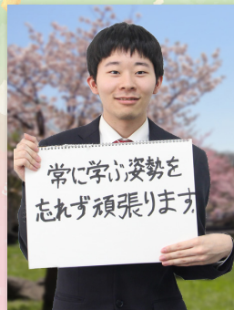
農政課 農政係兼地籍係