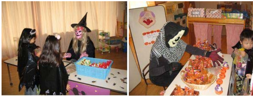
おやつをもらう部屋(先生達もがんばりました)