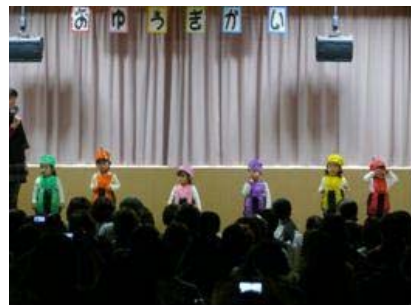
ちびっこマン体操(すずらん)