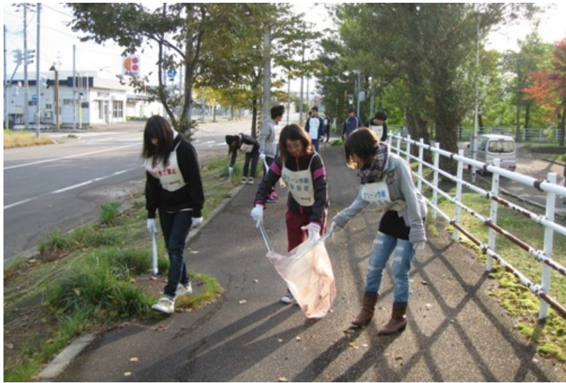
市役所若手職員の皆さま