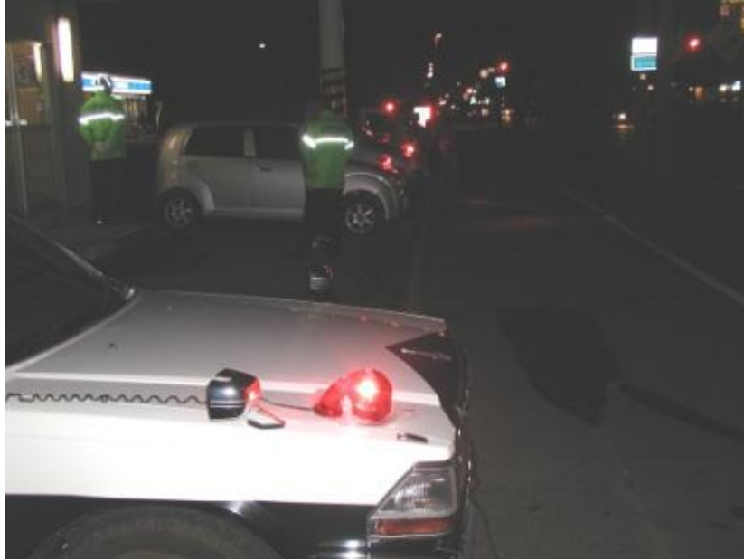
運転手会のパトライト