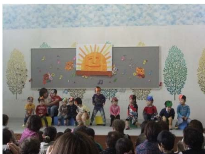
はらぺこあおむし(いちご)