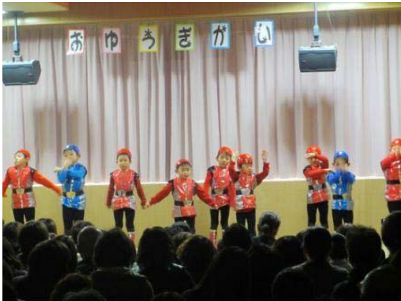
バスターレディゴー(あさがお)

先生方お手製の衣装に身を包み、歌、お遊戯、劇と、一生懸命に、かわいらしさとかっこよさを表現でき、「おおきなかぶ」と「すいかのたね」の劇でも素晴らしい演技を披露してくれました。かけつけた保護者の皆様も大声援を送っていました。