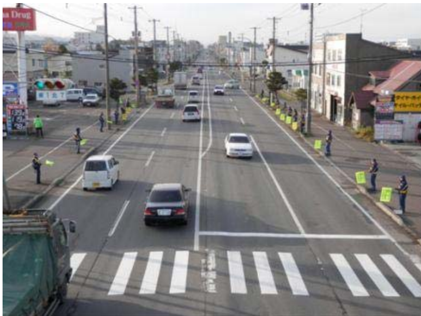
砂川消防署職員の皆さん

15日に雪はありませんでしたが、今週は景色が一変し、雪化粧となりました。 冬道は、歩行者にとっても自動車にとっても、路面状況を常に考えなければなりません。交通事故に遭わない・遭わせないとの強い気持ちを持って、市民の皆様が安全・安心に冬を過ごされますことを願っています。