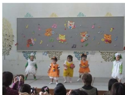
いち.にの.さ〜ん！(小いちご)