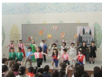
長靴をはいたネコ(ばなな)