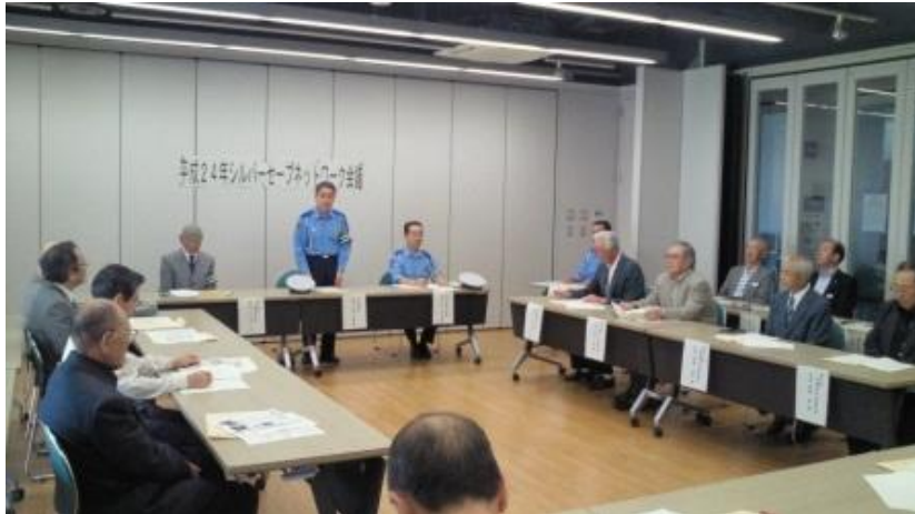
シルバーネットワーク会議