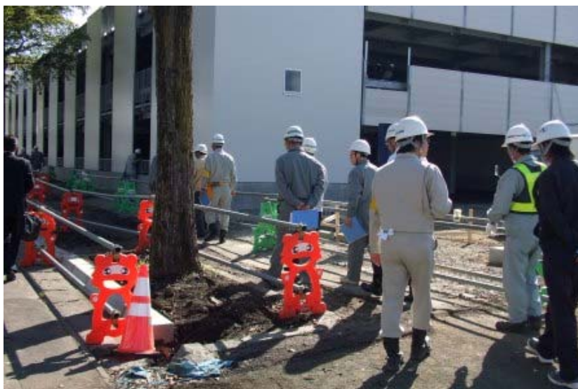
北2丁目(病院付近)ロードヒーティング工事。関係ありませんが、最近の安全柵はかわいくなりました

砂川市が発注した工事での事故は有りませんが、工事現場は安全が第一であります、今後とも事故が無いことをお願い致します。