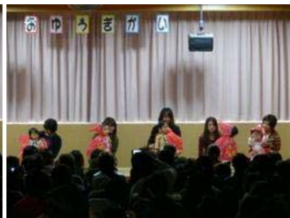
どんぐりころころ(たんぼぼ)