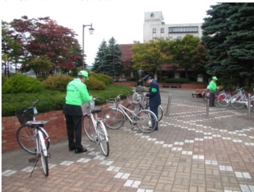
砂川防犯協会による自転車防犯診断