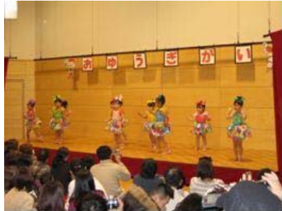
つけまつける(らいおん)