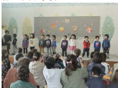
となりのトトロ(みかん)