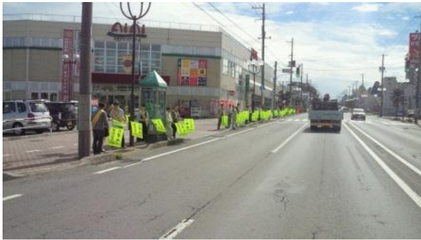
村田施設工業(株)公和会旗の波運動