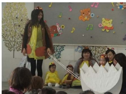
たまごのあかちゃん(さくらんぼ親子)