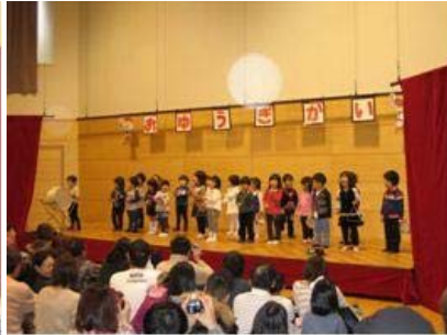
どんぐりころころ(ぱんだ)

今年、3ヶ所の保育所・保育園の「おゆうぎ会」を見学してきました。 それぞれのおゆうぎ会で、保育士達の工夫と奮闘ぶりを感じました。子ども達もしっかりと練習をして、見事にその成果を発揮してくれました。 子ども達は、日々成長しています。これからも明るく元気に育ててほしいと思います。 保護者の皆様のご協力に感謝申し上げます。 子育て支援の最前線となる保育の着実な前進のため、今後においても、保育園・保育所・子育て支援センターの園長・所長の指導力を頼りにしています。