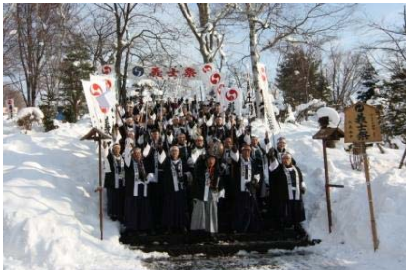
昨年の勝ちどきの様子

現在、それらに参加できる【義士隊員】を募集しております。 参加料は無料、年齢・性別を問わず、先着順で7日までの受け付けとなっております。参加者には『認定書』&『義士守護符』が記念品としてプレゼントされます。 ぜひ、1度貴方も【赤穂浪士】義士隊員として【勝どき】を一緒に上げてみませんか？ お問い合わせは、北海道義士会事務局 電話0125-53-3513まで(笑顔)！