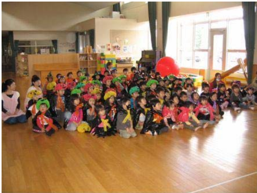
先生が読む絵本をみんな真剣に聞いています

ハロウインの時期を過ぎると、いよいよ冬の足音が聞こえてきます。園児達には寒さに負けないで元気に育ててほしいと思います。