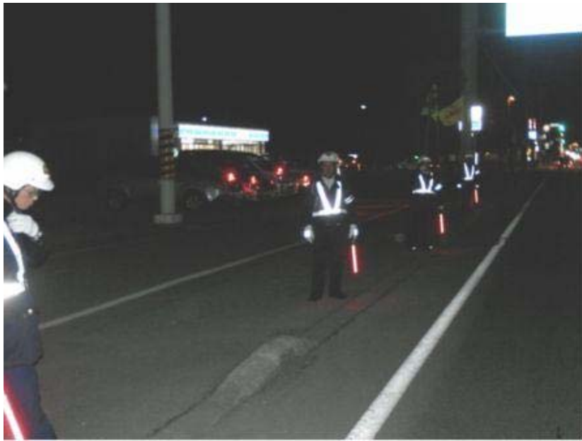
交通安全指導員会・交通安全協会の皆さん