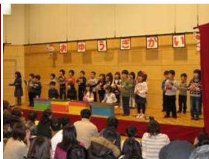
もりのくまさん(ぞう)