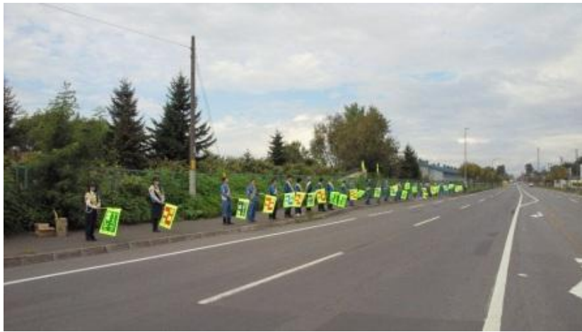
北海道電力砂川発電所旗の波