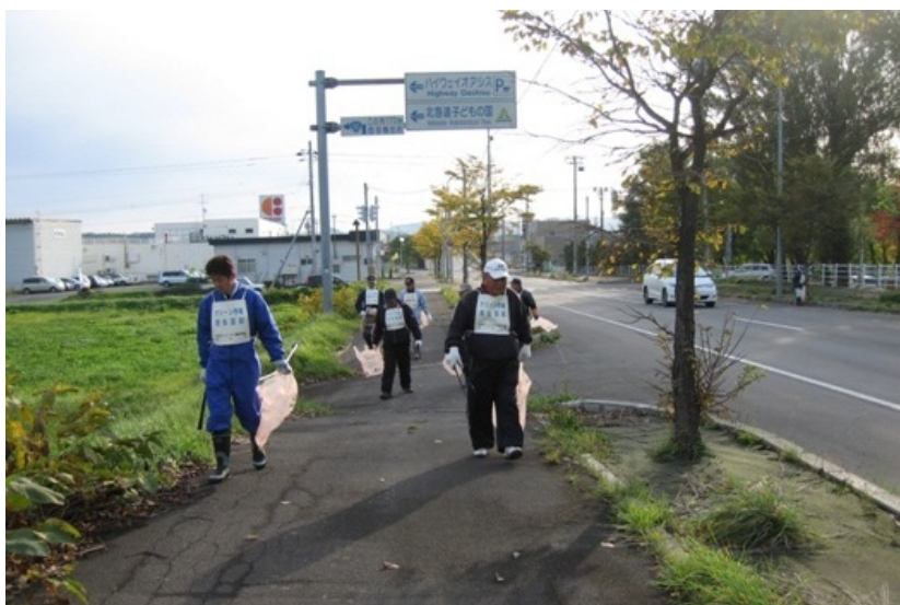
衛生組合の皆さま

参加いただきました衛生組合の皆様、市役所若手職員の皆様 大変ありがとうございました。