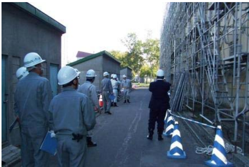
宮川改良住宅の現場です