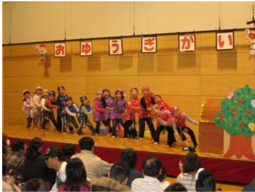
うんとこどっこい子ジャリンバ(らいおん)

当日は、子ども達が1部、2部合計18のお遊戯などを披露してくれました。 先生方と一緒に作った衣装も披露してくれ、歌、お遊戯、劇と、男らしさ、女らしさに加えて、「うんとこどっこい子ジャリンバ」では、すながわのスイートロードを題材に創作劇を披露してくれました。かけつけた保護者の皆様も大声援を送っていました。