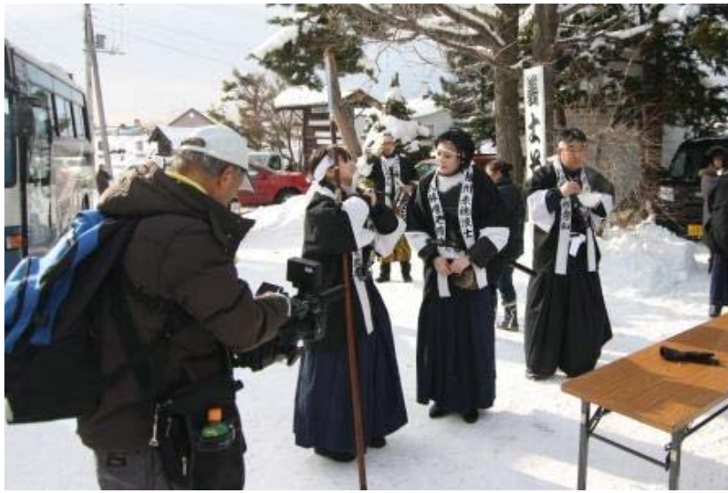
女性の方(市外から来ていただきました)も参加。毎年テレビ取材も来ています。