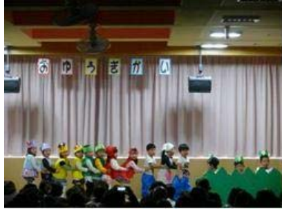
おおきなかぶ(ちゅうりっぷ)