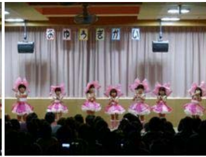
つけまつける(あさがお)