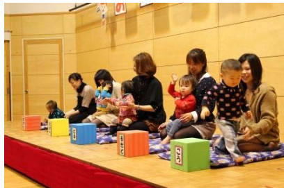
くるくるくる(ひよこ)