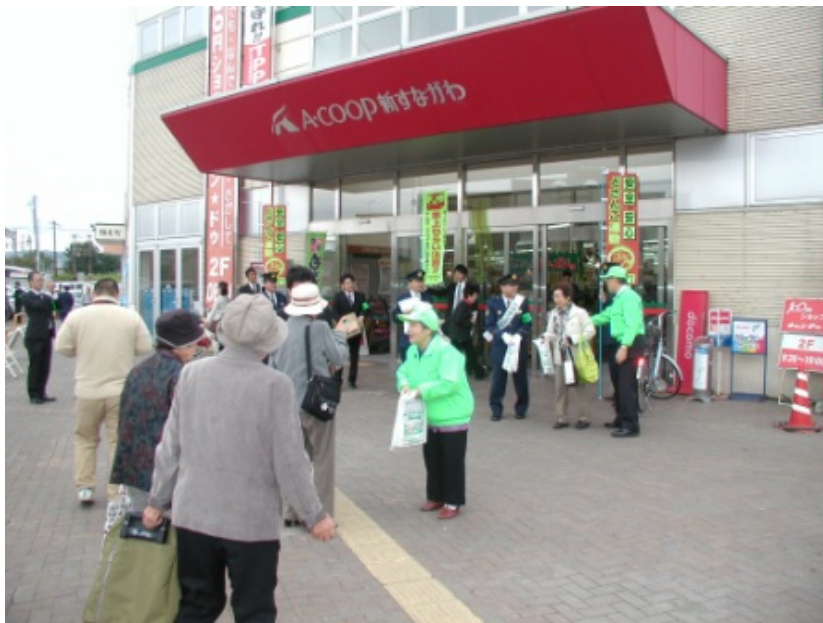
砂川防犯協会による街頭啓発