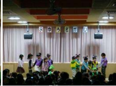
おむすびころりん(ばら)