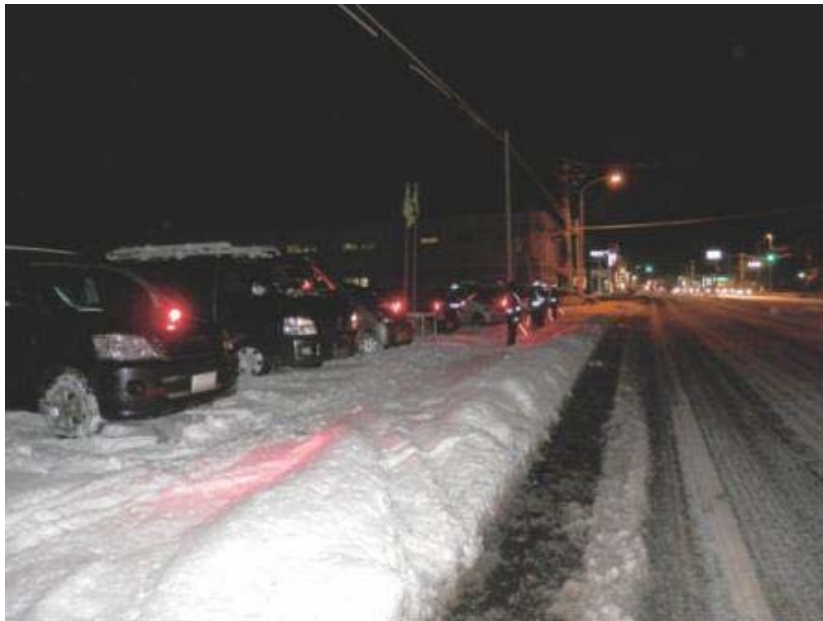
交通安全指導員会の皆さん

市内は今日以降も雪の日が続くと予報されています。市民の皆様、外出時は常に交通安全に心がけてくださるようお願いいたします。